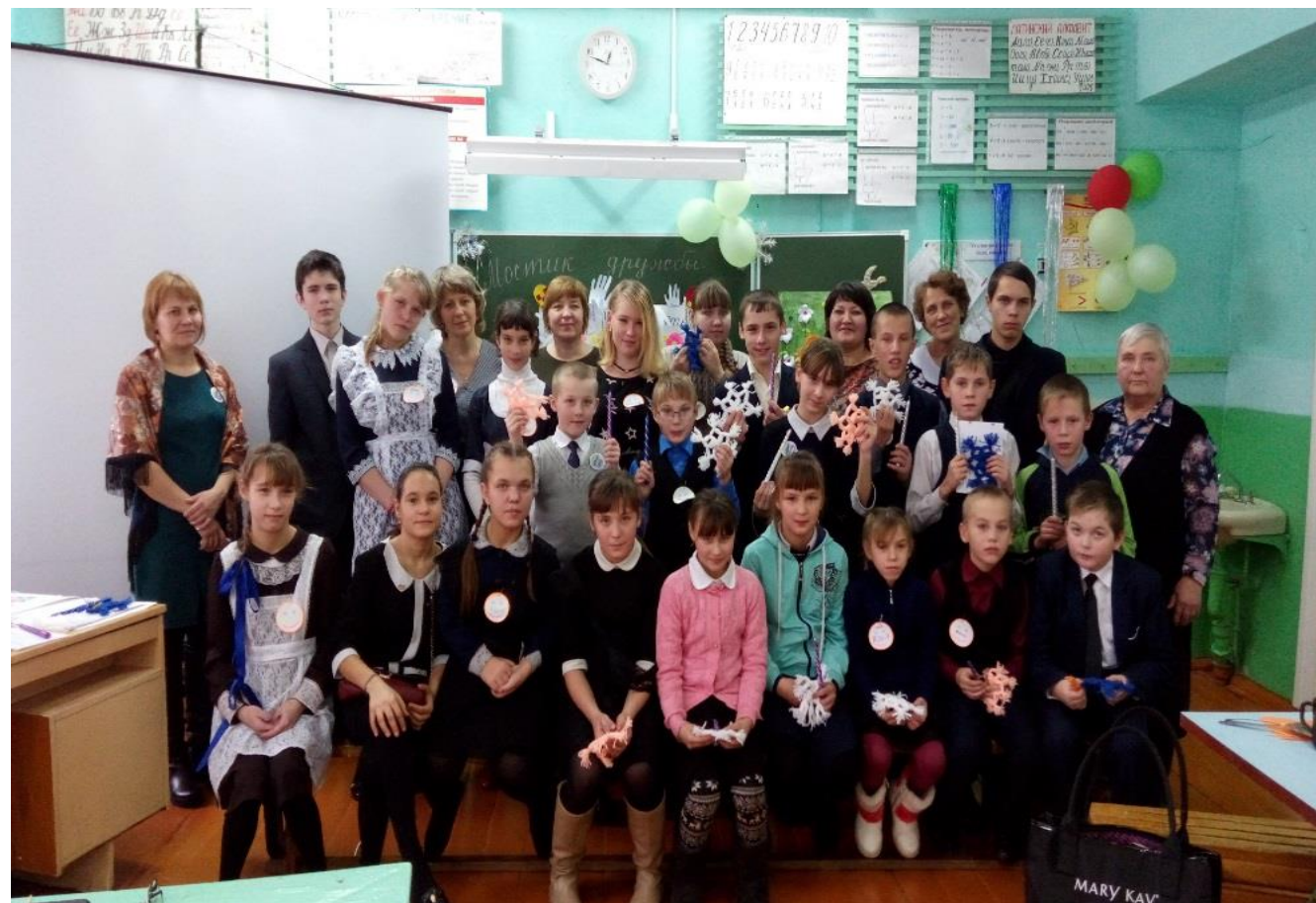
«Мостик дружбы» на базе МКОУ Рудовская СОШ