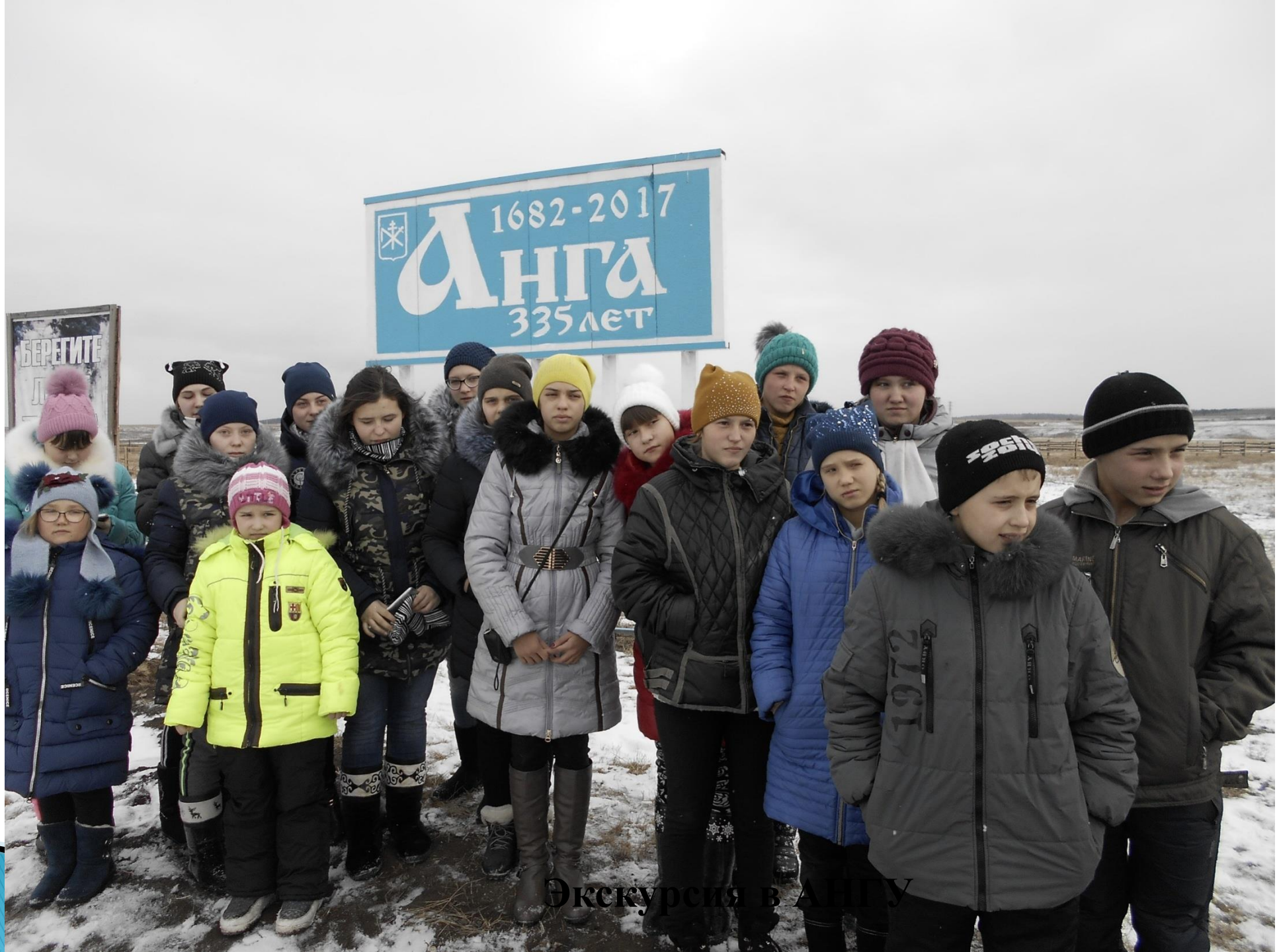
Экскурсия в Ангу