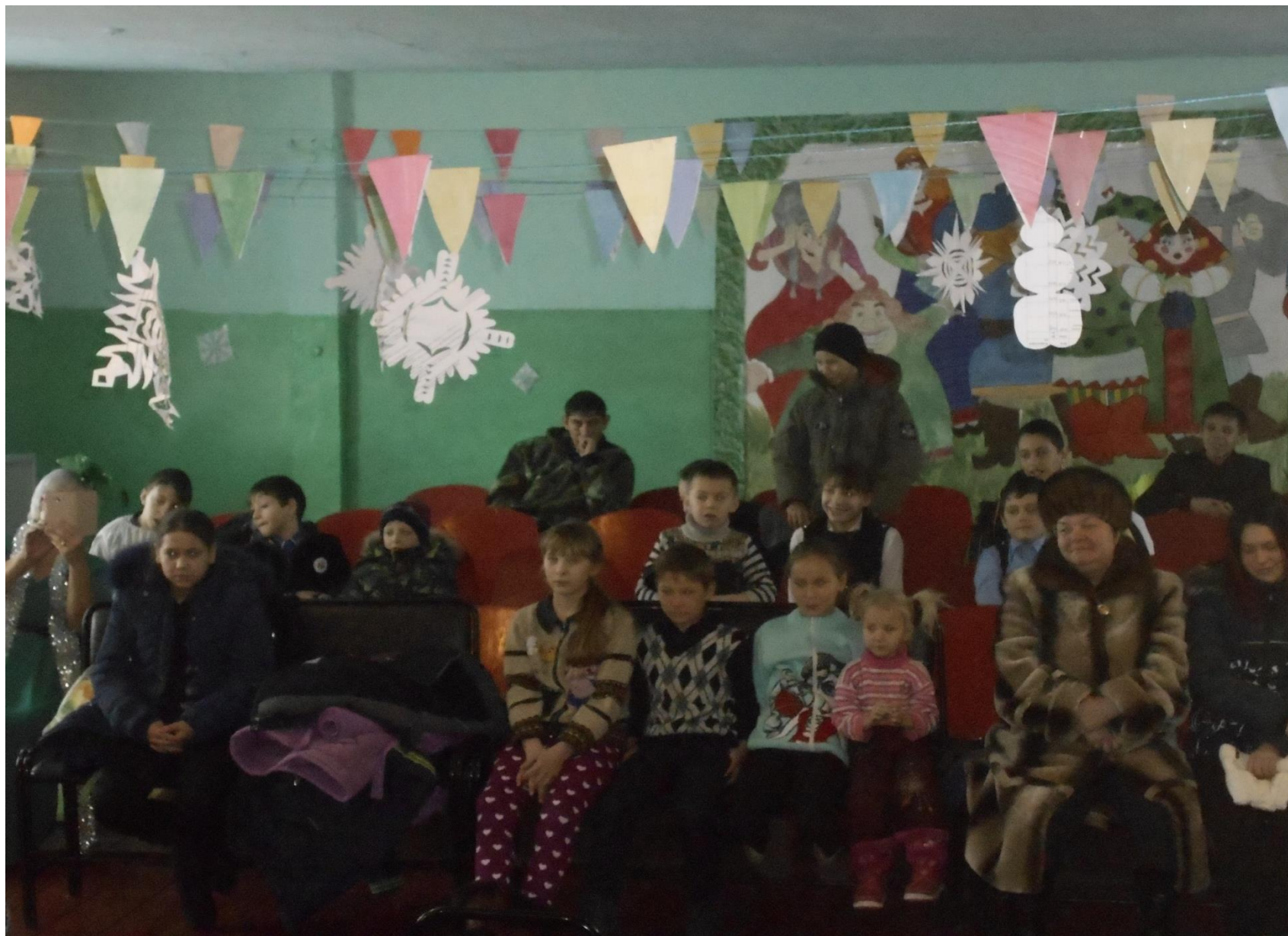
Зрители в д. Воробьёво